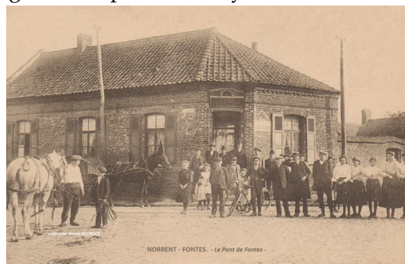
NORRENT - FONTES. - Le Pont de Fontes -

Au N° 91, en 1950 après agrandissements M Marcel Pouille installera son magasin de chaussures en exerçant parallèlement son activité sur les marchés de la région, jusqu'en 2000. En face au N°84 la forge Dequene, rythme la route nationale au son de son enclume. Leur fils Robert succédera à son père après le certificat d'étude. A la cessation d'activité de ce dernier l'atelier et magasin seront adaptés pour la confection et vente de menuiseries PVC « Calima », puis le magasin deviendra salon de coiffure « Epi tête » et actuellement la boucherie charcuterie traiteur, Lecocq et Westerlynck. Le N° 93 peu d'entre nous se souviennent de l'Estaminet Hubert devenu par la suite l'exploitation agricole de M Hannotte.