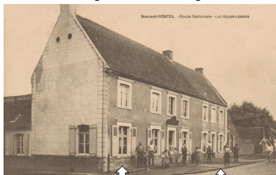
N°87 Café Tellier Cardon N°85 l'épicerie du Pas-de-Calais