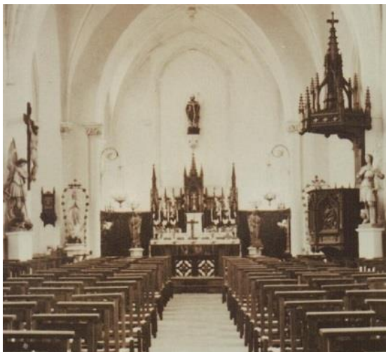
Choeur avec l'ancien autel et banc de communion

opposition à la pratique d'une célébration dans le même sens que les fidèles sur un autel attaché au mur de l'édifice. La réforme liturgique conduit également à l'élimination du banc de communion afin de ne plus avoir de séparation physique entre les deux espaces ( chœur et nef ).