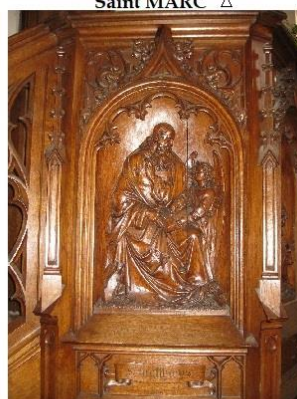
Saint MATHIEU Δ