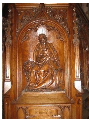
Saint MARC Δ