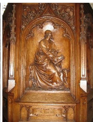
Saint LUC Δ