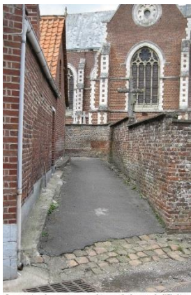
Le sentier des moines au départ de la rue de l'Eglise

d'Ham en Artois, qui arrivaient du sentier de Waringhem, l'empruntaient pour traverser la route nationale, longeaient l'auberge de la porte d'or pour aboutir à l'intersection située un peu plus haut que le nouveau cimetière. De là ils se dirigeaient via Lingham à L'abbaye St André de Witternesse, ou poursuivaient leur route juste Théroouanne autrefois diocèse.