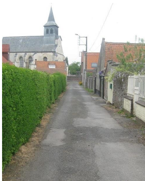
Sentier de Waringhem aboutissant rue de l'église